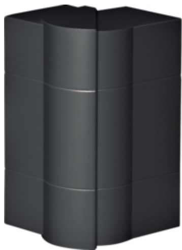
tehalit.BRN65/ BR65 Kąt zewnętrzny 65x170, czarny