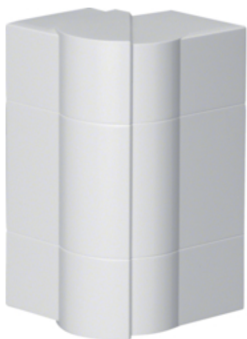
tehalit.BRN65/ BR65 Kąt zewnętrzny 65x170, biały