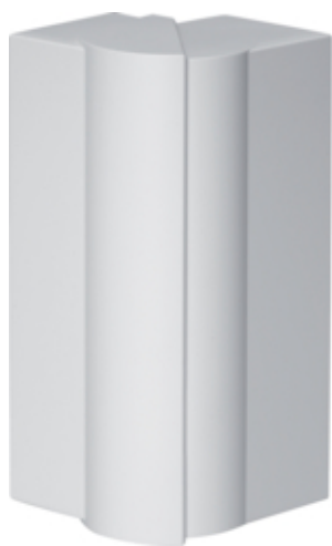
tehalit.BRN65/ BR65 Kąt zewnętrzny 65x210, biały