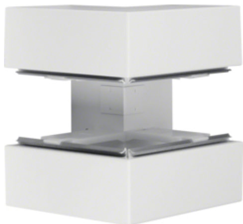
tehalit.BRS Kąt zewnętrzny 100x210 stal biały