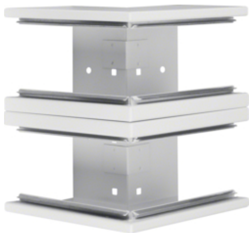
tehalit.BRS Kąt zewnętrzny 100x210 D stal biały