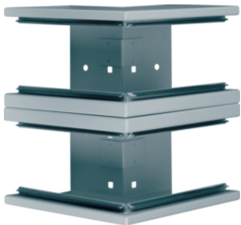
tehalit.BRS Kąt zewnętrzny 100x210 D stal ocynk