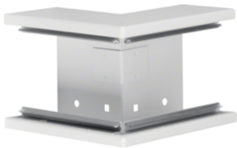
tehalit.BRS Kąt zewnętrzny 65x100, stalowy, biały