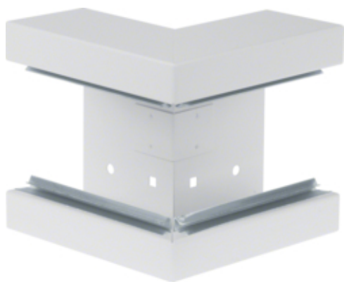
tehalit.BRS Kąt zewnętrzny 65x130, stalowy, biały