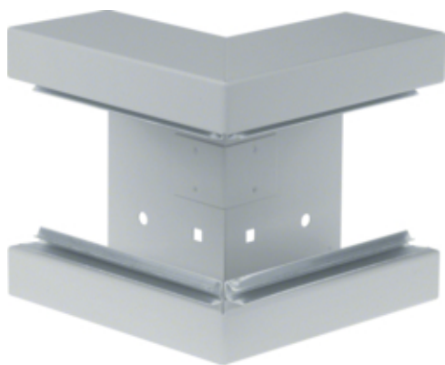
tehalit.BRS Kąt zewnętrzny 65x130, stalowy, ocynkowany