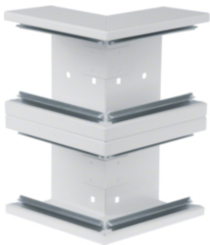
tehalit.BRS Kąt zewnętrzny 65x210 D, stalowy, biały