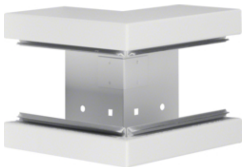
tehalit.BRS Kąt zewnętrzny 85x130 stal biały