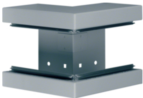
tehalit.BRS Kąt zewnętrzny 85x130 stal ocynk