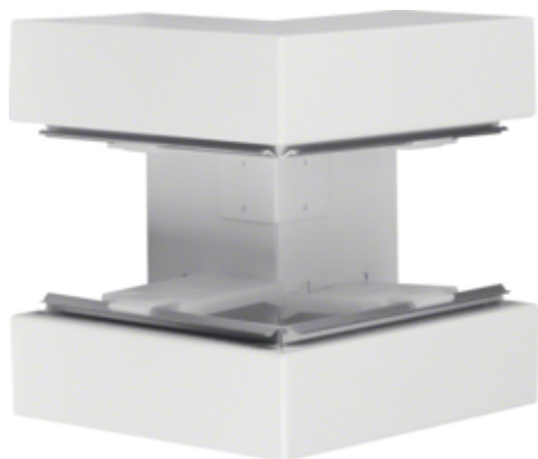
tehalit.BRS Kąt zewnętrzny 85x170 stal biały