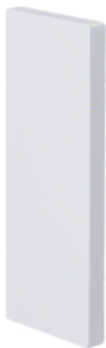
tehalit.BRP Końcówka 65x210 2 komory, biały