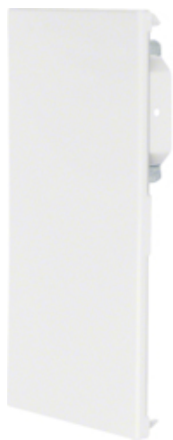
tehalit.BRS Końcówka 100x210 D biały