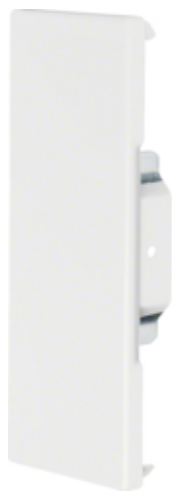
tehalit.BRS Końcówka 65x170, biała