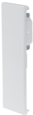
tehalit.BRS Końcówka 65x210 D, biała