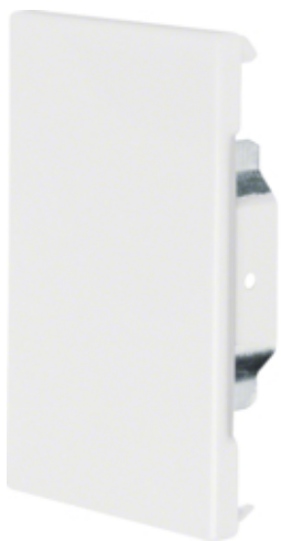
tehalit.BRS Końcówka 85x130 biały