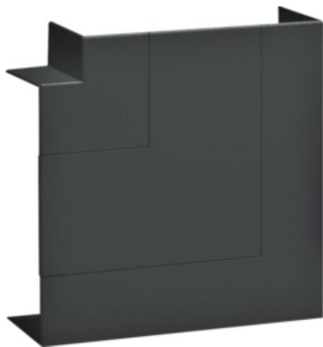
tehalit.BRN65/ BR65 Kąt płaski 65x170, czarny