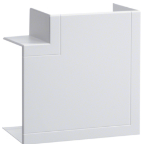
tehalit.BRP/BRAP Kąt płaski 65x100, biały