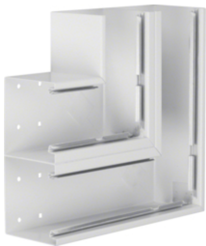
tehalit.BRS Kąt płaski 100x210 D stal biały