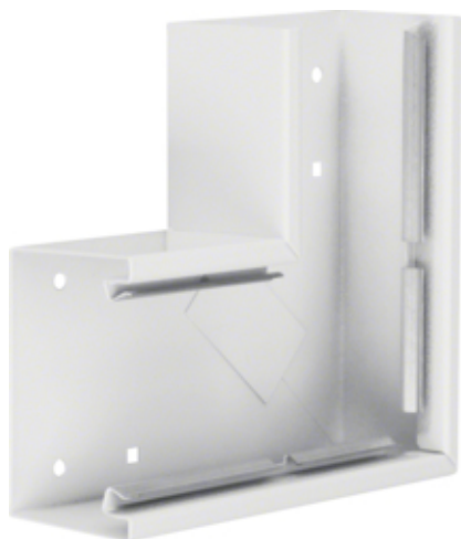
tehalit.BRS Kąt płaski 65x100, stalowy, biały