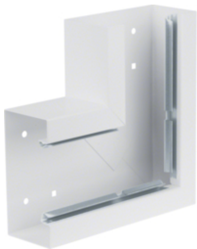
tehalit.BRS Kąt płaski 65x130, stalowy, biały