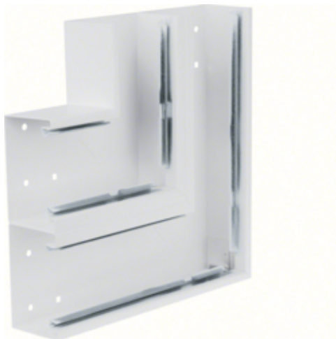
tehalit.BRS Kąt płaski 65x210 D, stalowy, biały