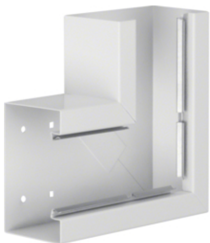
tehalit.BRS Kąt płaski 85x130 stal biały