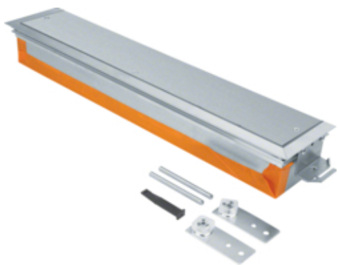
tehalit.BK Końcówka kanału wanna stalowa BKW 600x(70-110)mm stal