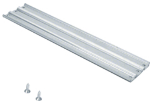
tehalit.BK Poprzeczka wzmacniająca N=300 stal