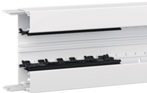
tehalit.BRN65 Podstawa 170mm, biały