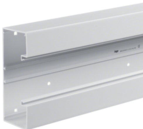
tehalit.BRP Kanał PVC podstawa 65x170, biały