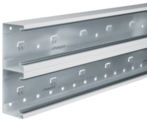
tehalit.BRS Podstawa 210mm 2 komory, stal, biały