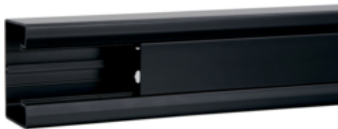
tehalit.GBD Kanał elektroinstalacyjny 50x85mm czarny