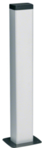
tehalit.DA200 Minikolumna jednostronna DA200-80 H=650mm biały