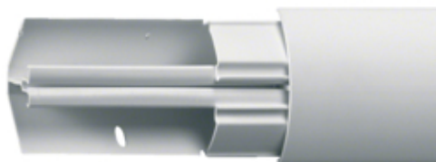
tehalit.EK Kanał narożnikowy 40040 L=2500mm biały