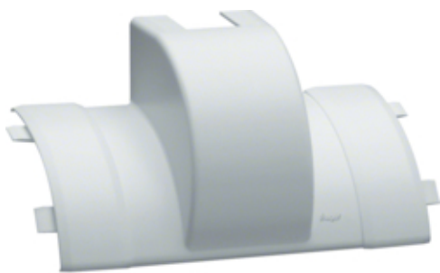
tehalit.EK Odgałęźnik 40x40mm biały