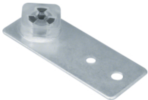
tehalit.BK Podstawa mocująca śrubę M8 do kanałów BK