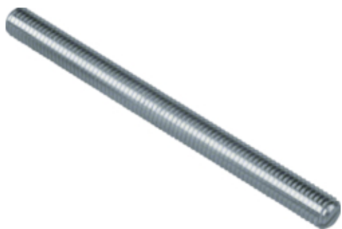
tehalit.BK Śruba M8x100 BK