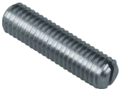
tehalit.BK Śruba M8x30 BK