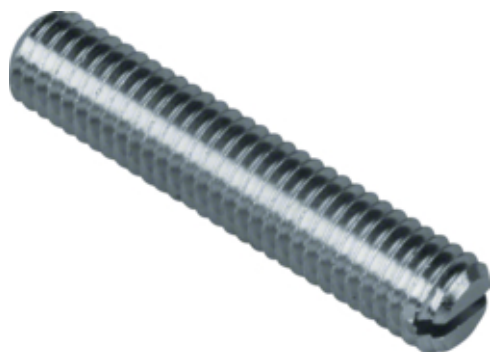
tehalit.BK Śruba M8x40 BK