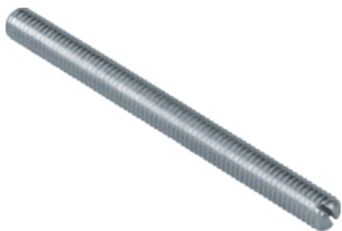
tehalit.BK Śruba M8x90 BK