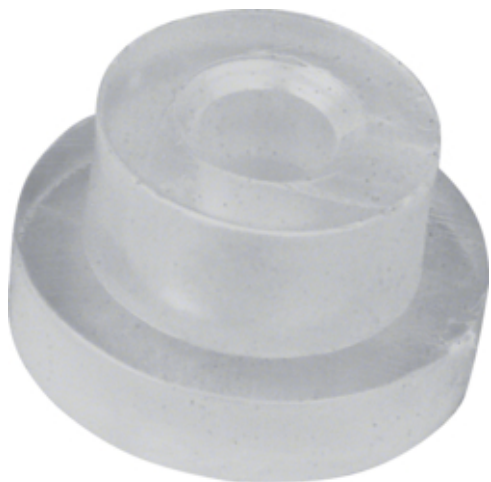
tehalit.BK Izolator podstawy mocującej śrubę M8 do kanałów BK