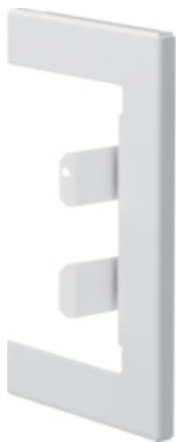
tehalit.BR65/BRS Maskownica przebicia 65x100, biała