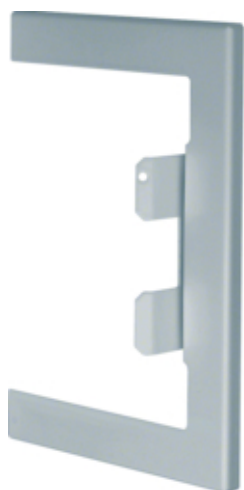
tehalit.BRS Maskownica przebicia 100x130 ocynk