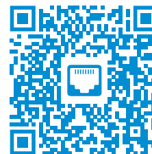
TABELA DOPASOWANIA MODUŁÓW KEYSTONE

Zweryfikuj kompatybilność Modułów Keystone RJ45 marek ALANTEC, Q-LANTEC oraz WireArte z najpopularniejszymi na rynku adapterami systemowymi. Odpowiednie dopasowanie modułów do osprzętu gwarantuje bezpieczeństwo oraz niezawodność instalacji. Tabela kompatybilności obrazuje, które moduły gniazd RJ45 produkcji A-LAN, pasują do osprzętu popularnych producentów systemów instalacyjnych.