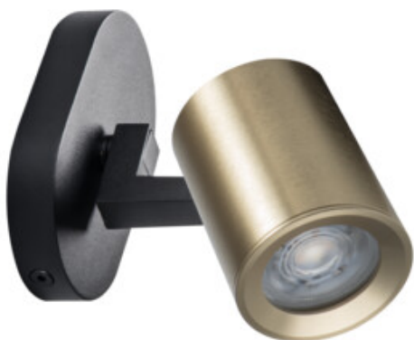
LAURIN EL-10 B-G