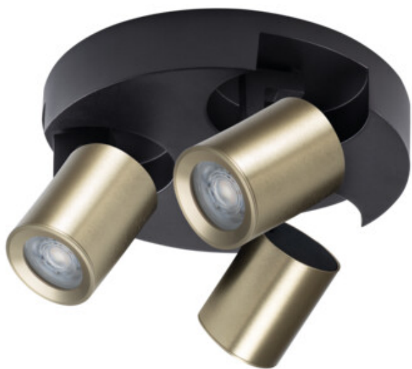
LAURIN EL-30 B-G