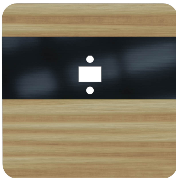
Czołówka czujnika laserowego DRL-12 wersja kolorystyczna sosna czarny