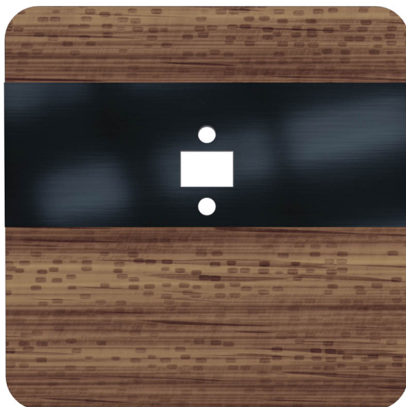
Czołówka czujnika laserowego DRL-12 wersja kolorystyczna afromozja czarny