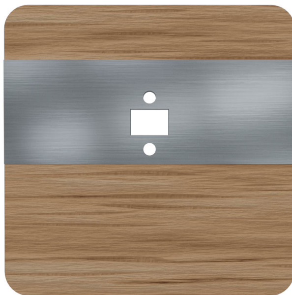
Czołówka laserowego czujnika odległości DRL-12 wersja kolorystyczna dąb satyna

Warianty kolorystyczne czołówki laserowego czujnika odległości: