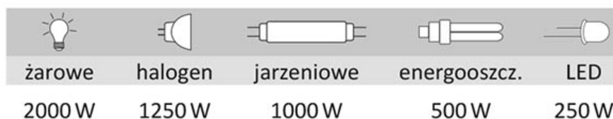
Tabela dla obciążeń zasilanych napięciem 230 V AC

BIS-413M-LED 24V nie może współpracować z przyciskami podświetlanymi.