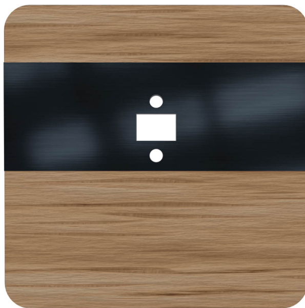
Czołówka czujnika laserowego DRL-12 wersja kolorystyczna dąb czarny

Pozostałe warianty kolorystyczne frontu czujnika: